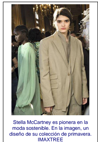
Stella McCartney es pionera en la moda sostenible. En la imagen, un diseño de su colección de primavera.

Según el último informe del estado de la moda que elaboró McKinsey & Company en colaboración con el portal The Business of Fashion , la llamada economía circular es hoy la clave de un negocio que tira a la basura cerca de 500.000 millones de euros en ropa al año. Es decir, no se trata solo de daño ecológico, sino también económico (que es donde le duele a la industria). Hasta la fecha, apenas el 1% de los materiales utilizados en la confección se recicla para fabricar nuevos productos, de